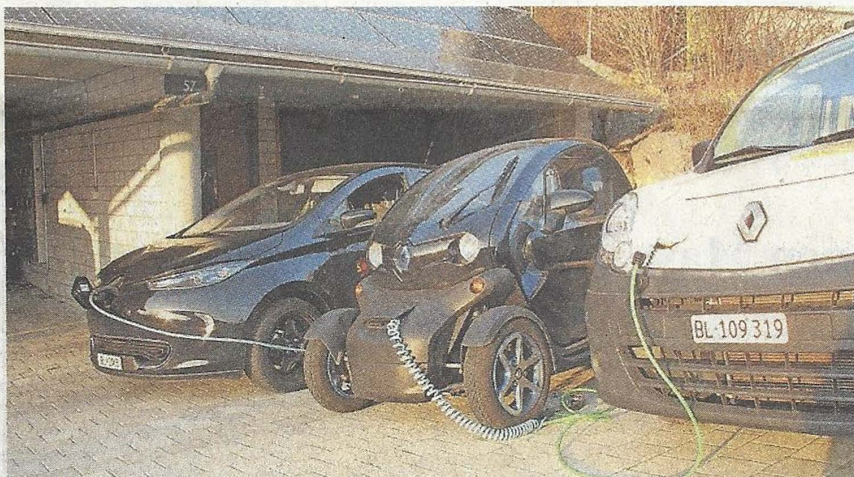
Ladeinfrastruktur für E-Mobile.

Es erwartet Sie eine kleine Verpflegung zusammen mit einem Schluck «Dielenberger Himmellüpfli».